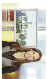
z.B.: Berichterstattung im WDR